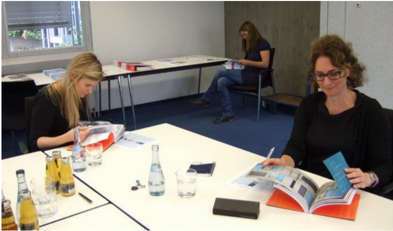
Die Jurysitzung des bba-Wettbewerbs "Planer-Kommunikation".