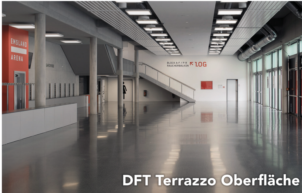
DFT Terrazzo Oberfläche