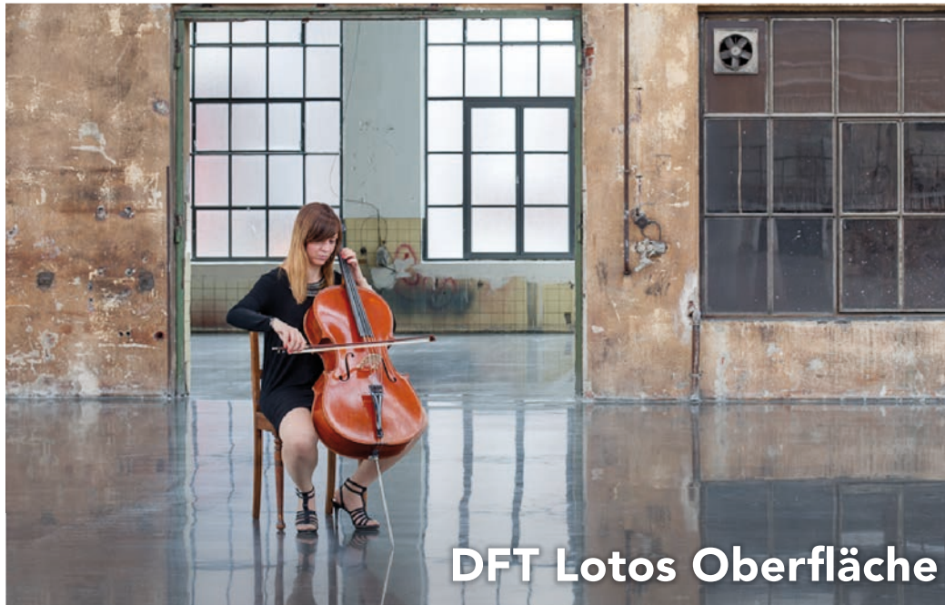
DFT Lotos Oberfläche